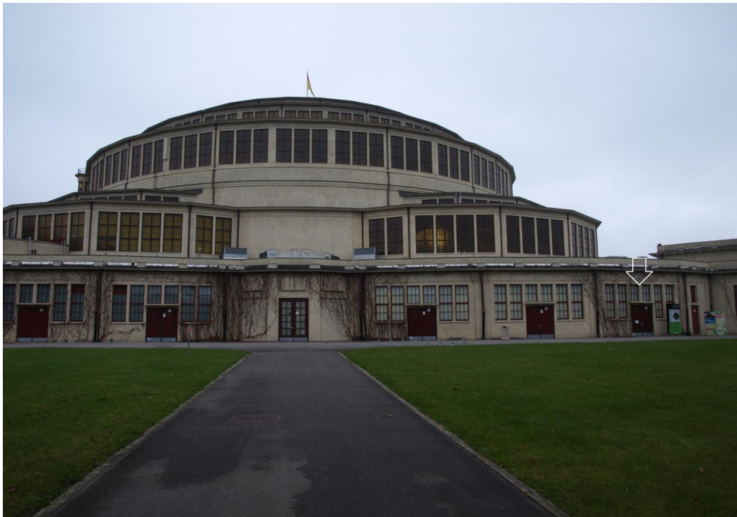
Wejście do Centrum Poznawczego Hali Stulecia zaznaczone strzałką.